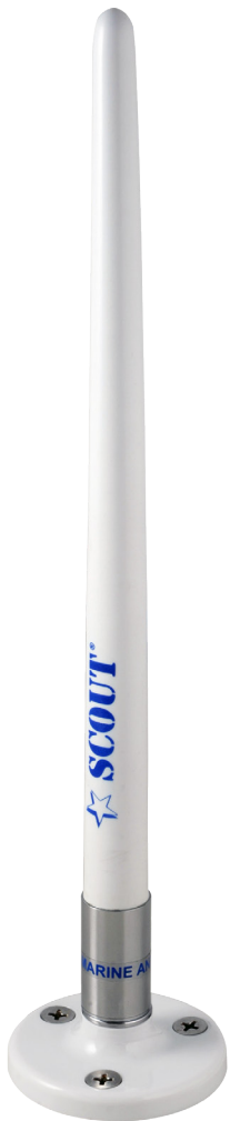
High flexibility and resistance

Die Antenne wird mit einem 4 m AM-FM Kabel und Schalter geliefert.