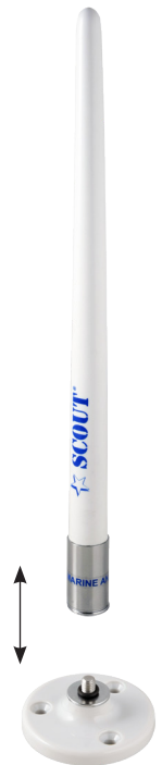
Fast whip removing